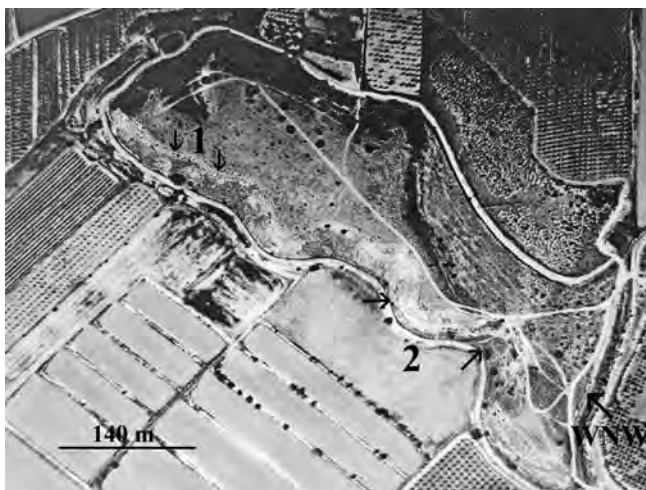
Figura 2. Localització de les subpoblacions de romer «1» i Tyrinnus leucographus «2» al Tossal de l'Infern.

hemum marifolium (L.) Mill. subsp. marifolium , H. violaceum (Cav.) Pers. (= H. pilosum (L.) Pers.), Teucrium capitatum L. subsp. capitatum i T. gnaphalodes L'Hér.