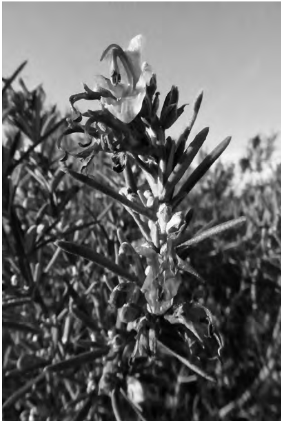
Figura 3. Flors de romer afectades per les gelades. Tossal de l’Infern (gener de 2019).