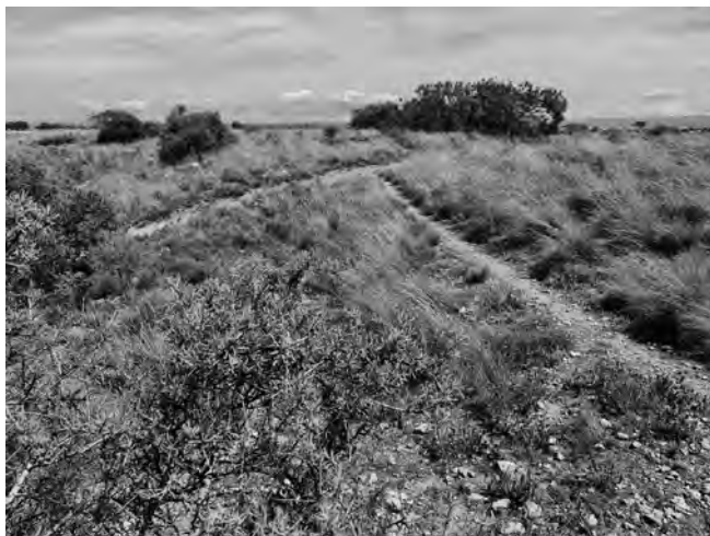
Figura 4. Tossal de l’Infern: els vestigis de carrascar i la brolla on destaca Stipa offneri .