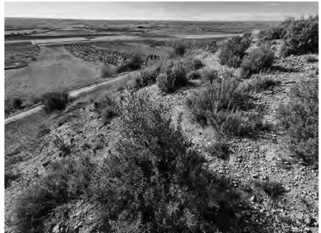
Figura 5. La població de romer del Tossal de l’Infern se situa a les parts altes del vessant S.