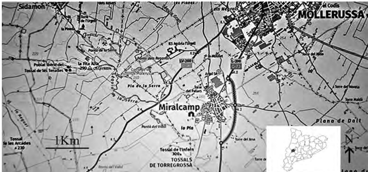
Figura 1. La major part de l'estudi s'ha efectuat en els tossals d'aquesta zona del Pla d'Urgell.