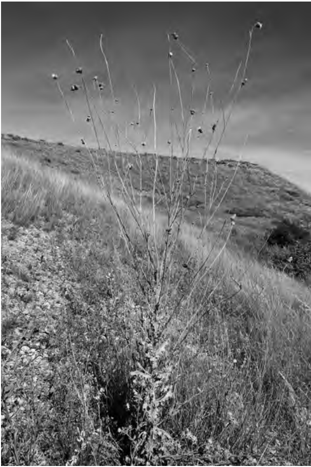
Figura 7. Tyrimum leucographus a les parts baixes del vessant S del Tossal de l'Infern.

s'havien recuperat i estaven ben florits al febrer. Els resultats de les poblacions de romer del Tossal Gros i dels guixos de la Sentiu de Sió-Bellcaire d'Urgell, són congruents amb el suara esmentat.